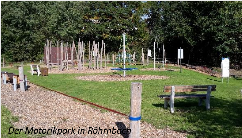
Der Motorikpark in Röhrnbach

Das Projekt ist Teil des niederbayernweiten Kooperationsprojekts „Bewegtes Niederbayern“. Der Motorik-Park stellt ein wahres Bewegungsparadies für alle Bevölkerungsgruppen und Altersstufen dar. Vom Kindergarten-/Schulkind über Fitness- und Leistungssportler bis zu aktiven Senioren. Jeder Gast kann hier in einer wunderschönen Naturlandschaft einen wesentlichen Beitrag zur persönlichen Gesundheit und Fitness leisten. Die hier umgesetzten Bewegungsangebote und Bewegungsideen erleichtern den Startschuss zu einem bewegungsorientierten Leben bzw. unterstützen wesentlich ein regelmäßiges Training. Der Motorik-Park sowie der Barfußweg sollen auch als Ergänzung für die Kindergarten- sowie Schulkinder in Bezug auf das Erlernen von vielfältigen Bewegungsmöglichkeiten und das Erleben der eigenen Sinne durch einfaches Weglassen von Schuhwerk dienen.