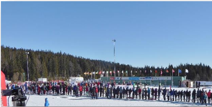
Das barrierefreie Freizeit- und Sportgelände in Finsterau

Bereits in der Vergangenheit fanden im Biathlonzentrum in Finsterau bedeutende Wettkampfveranstaltungen im Bereich des Behindertensports statt. Um auch in Zukunft solche Veranstaltungen durchführen zu können, wurde die bisher unzureichende Infrastruktur mit diesem Projekt verbessert. Die bestehende Biathlonanlage in Finsterau wurde hierzu barrierefrei ausgebaut und eine ebenfalls barrierefreie Multifunktionshalle wurde errichtet. Ziel ist es zum einen, den Behindertensport in der Region zu stärken. Zum anderen sollen auf dem Gelände weiterhin bedeutende Wettkampfveranstaltungen im Bereich des Behindertensports durchgeführt werden, wodurch auch der Tourismus in der Region profitieren wird. Die Multifunktionshalle wird außerhalb der Wettkampfzeiten zur Bereicherung des Vereinslebens in der Gemeinde Mauth von den örtlichen Vereinen genutzt. Auch Verbände/Vereine für Menschen mit Handicap (u. a. die Lebenshilfe) führen hier Veranstaltungen durch.