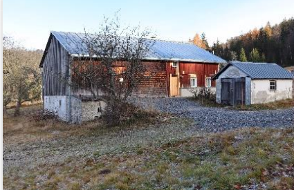
Das Denk-Haus