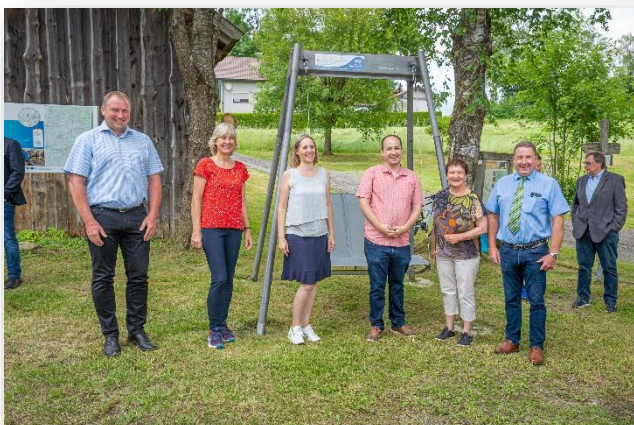
Eröffnung des Radgebiets Donau-Moldau (LEADER-Projekt „Von Fluss zu Fluss“)

Die erforderliche einheitliche Radwegbeschilderung wurde seitens der ILE-Kommunen realisiert. Das begleitende Projektmanagement wurde über das Amt für Ländliche Entwicklung (ALE) Niederbayern gefördert.