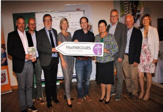
Die FRG-Akteure zum „Bewegten Niederbayern“ auf der Abschlussveranstaltung

sind folgende Aspekte neu: Zum einen beteiligten sich daran neu gegründete LAGen, zum anderen ist die Vielfalt der Einzelprojekte/Teilprojekte in der Art, Konzeption und Gestaltung der Bewegungsparcours größer. Insgesamt profitiert ganz Niederbayern an der gesundheitstouristischen Aussichtung. Für die Bewegungsparcours wurden separate Förderanträge für jedes Teilprojekt gestellt. Der gemeinsame Förderantrag (Dachantrag) ist das verbindende Element aller Teilprojekte und besteht aus drei Bausteinen: Baustein 1: Gemeinsames Informations- und Fortbildungsangebot für Multiplikatoren aus allen beteiligten Teilprojekten/Kommunen; Baustein 2: Gemeinsame Öffentlichkeitsarbeit; Baustein 3: Evaluierung des Projektes während und am Ende der Laufzeit.