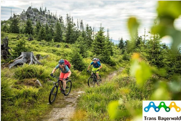
Auf der Mountainbike-Strecke Trans-Bayerwald im Dreisesselgebiet