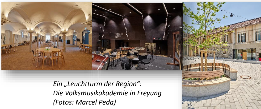
Ein „Leuchtturm der Region“: Die Volksmusikakademie in Freyung

Im historischen „Langstadt“ im Zentrum von Freyung wurde die erste Volksmusikakademie Bayerns realisiert. Im Erdgeschoss des „Langstadts“ befindet sich ein beeindruckendes Gewölbe, das als Aufenthaltsraum dient. Außerdem befinden sich im Erdgeschoss das Foyer, das Sekretariat, die Küche und der große Probensaal. Im ersten Stock sind die Seminar- und Übungsräume zu finden. Die hohen Anforderungen an Akustik, Schalldämmung und Raumklima wurden bei Planung und Bau berücksichtigt, um so eine optimale Nutzung der Räumlichkeiten möglich zu machen. Gegenüber des „Langstadts“ entstand ein mit dem Hauptgebäude verbundenes, barrierefreies Bettenhaus, welches äußerst schlichte Schlafmöglichkeiten anbietet. Über LEADER wurde in erster Linie die Ausstattung der Aufenthalts-, Probe- und Seminarräume der Volksmusikakademie Bayern gefördert.