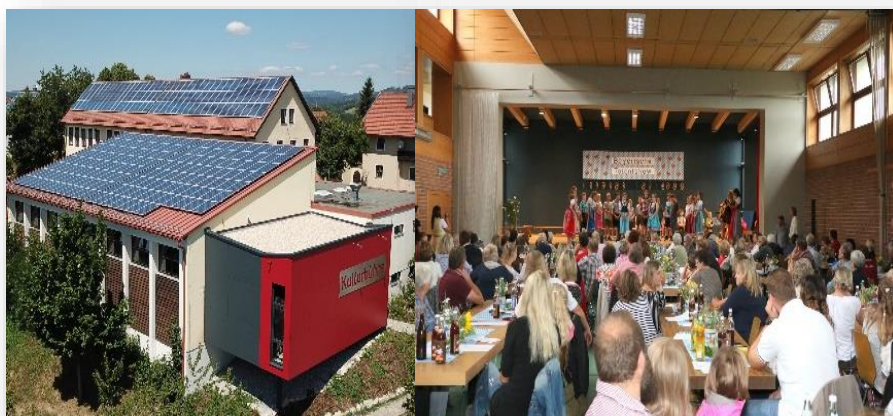
Die Kulturbühne in Haus im Wald

Als optische und praktische Aufwertung der Veranstaltungshalle wurde die Halle im Rahmen des LEADER-Projekts um einen Bühnenanbau erweitert, wodurch sich der Aufbau bei Veranstaltungen leichter gestaltet, mehr Platz für Besucher und Gäste vorhanden ist und parallel Veranstaltungen durchgeführt werden können. Es ist somit ein attraktiver Veranstaltungsort für lokale, regionale und überregionale Veranstaltungen entstanden, durch den das kulturelle und soziale Leben im Haus im Wald gefördert wird.