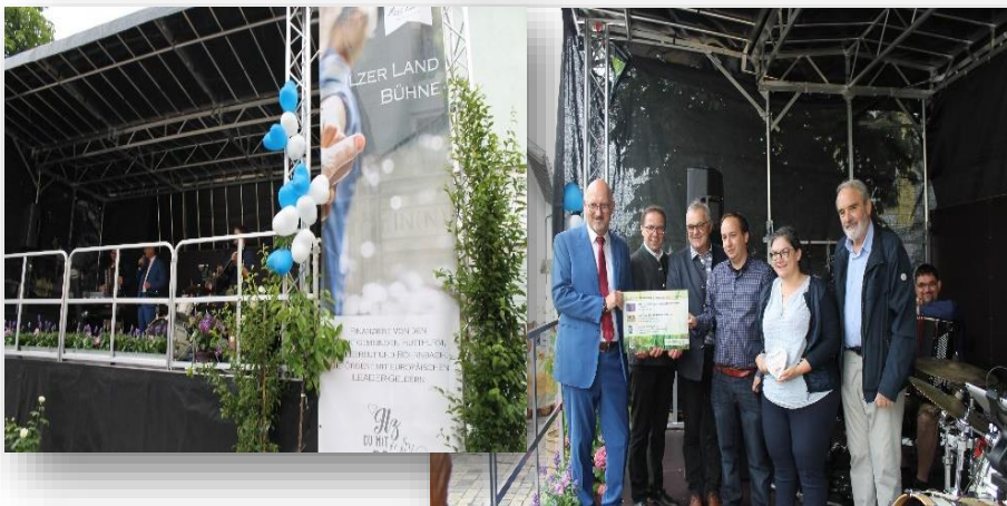
Die „Mobile Bühne Ilzer Land“

Im Rahmen des Projekts wurde deshalb eine mobile Bühne zur Nutzung durch die Ilzer Land Gemeinden angeschafft und ein Stellplatz für diese errichtet. Der Aufbau der mobilen Bühne dauert nur ca. 20-30 Minuten.