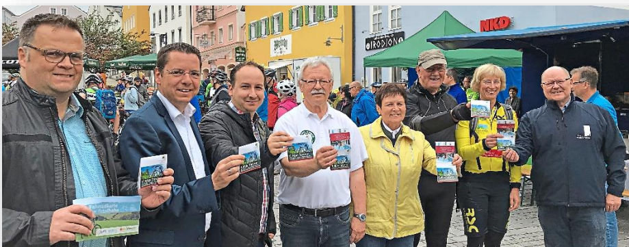
Präsentation des Flyers mit den schönsten E-Bike-Touren um Waldkirchen. Für die Umsetzung zeigte sich die Senioren E-Bike Gruppe Männer Waldkirchen verantwortlich. Die Maßnahme wurde gefördert im Rahmen des Projekts „Unterstützung Bürgerengagement“.

Das Projekt „Unterstützung Bürgerengagement in der LAG Landkreis Freyung-Grafenau“ dient der Umsetzung der Lokalen Entwicklungsstrategie (LES). Im Rahmen dieses Projekts unterstützt die LAG auf schriftliche Anträge hin nicht wettbewerbsrelevante Maßnahmen lokaler Akteure (keine kommunalen Körperschaften), die den Entwicklungszielen des LES dienen und das Bürgerengagement in der Region stärken. Im Rahmen des Projekts "Bürgerengagement" wurden beispielsweise ein Medientreff für Senioren, die Erweiterung eines Dorfgemeinschafts-Spielplatzes, die Sonderausstellung zum Grafenauer Volksfest, eine Karte mit den schönsten E-Bike-Touren um Waldkirchen und die Gestaltung der Außenanlage um den Dorfbackofen in Schönbrunn am Lusen unterstützt.