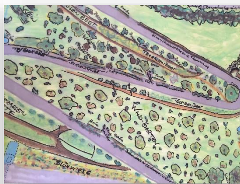
Der „DorfWaldgarten“ entsteht.