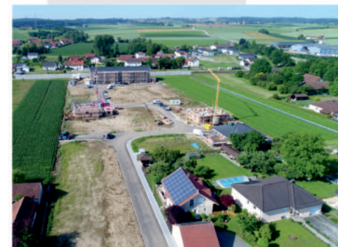
Bauliche Entwicklung in einer attraktiven Wohngemeinde