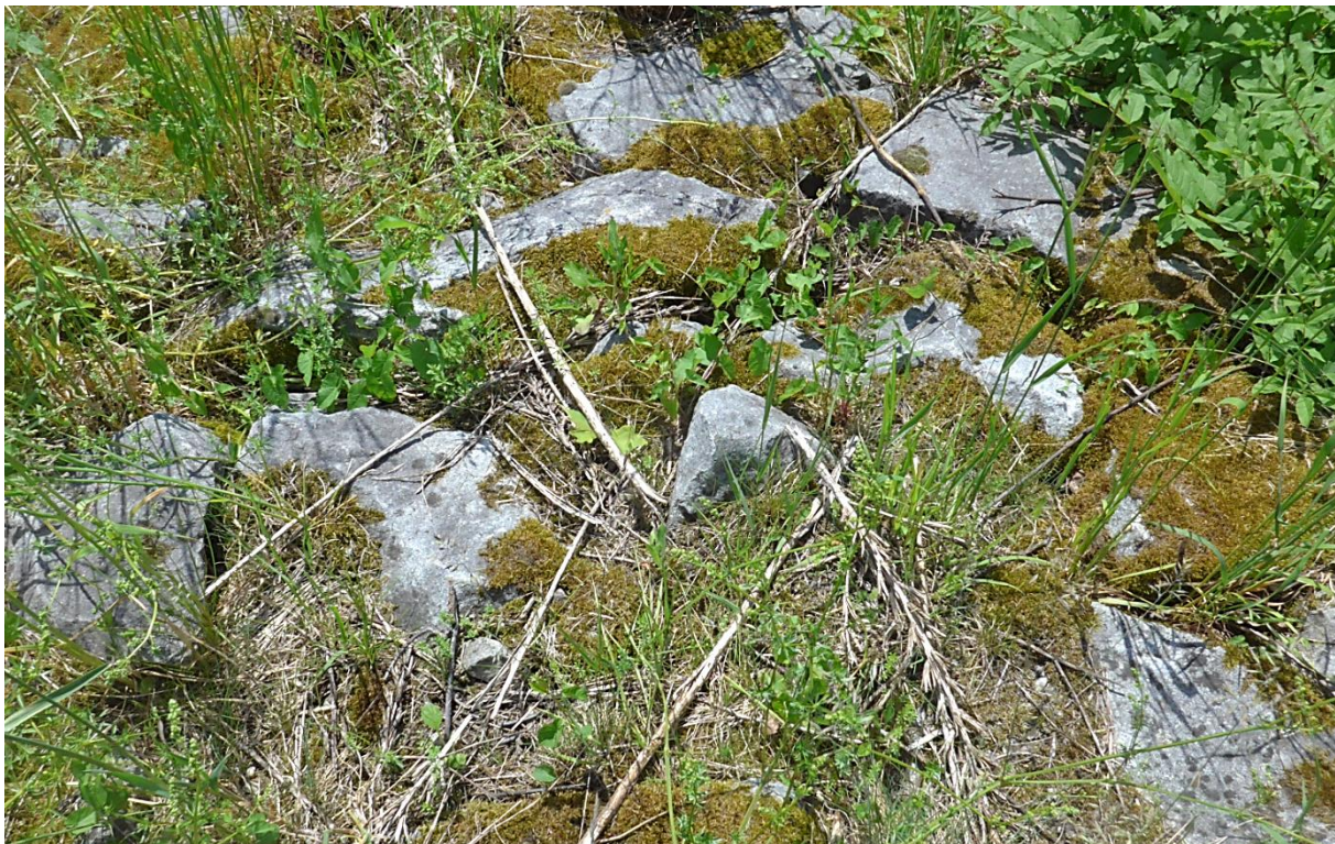
Bild 18: Standort: Dammkrone, Blick auf Steinsicherung der Ablaufmulde der HWE (2022)