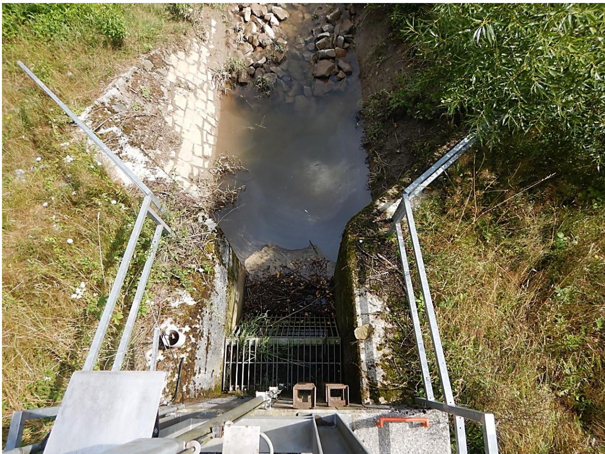
Bild 08: Standort: Dammkrone (Bediensteg), Blick nach unten auf Einlaufbereich (2019)