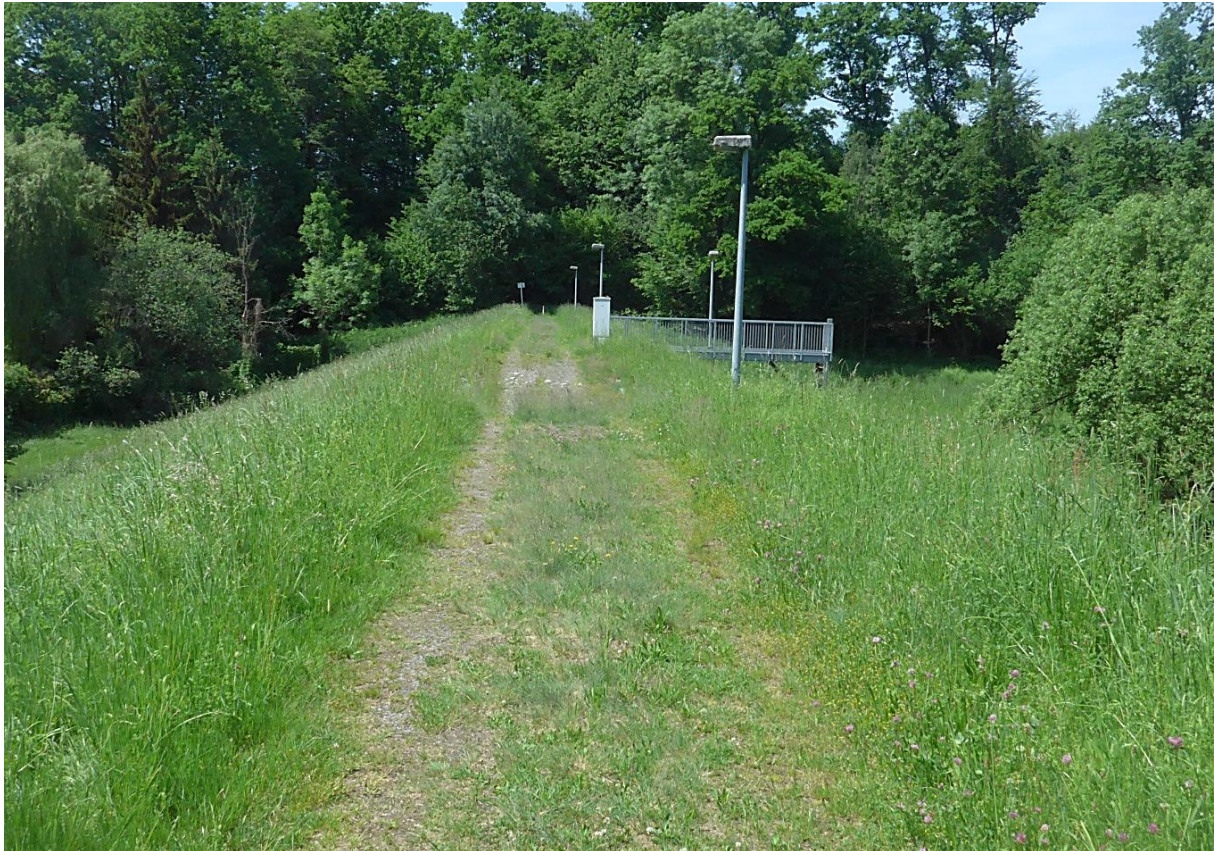
Bild 03: Standort: Südostrand der Dammkrone, Blickrichtung Nord-West (2022)