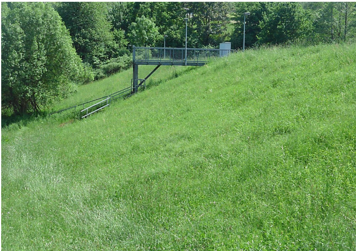
Bild 04: Standort: Dammfußpunkt Nord, Blick auf wasserseitige Böschung (2022)