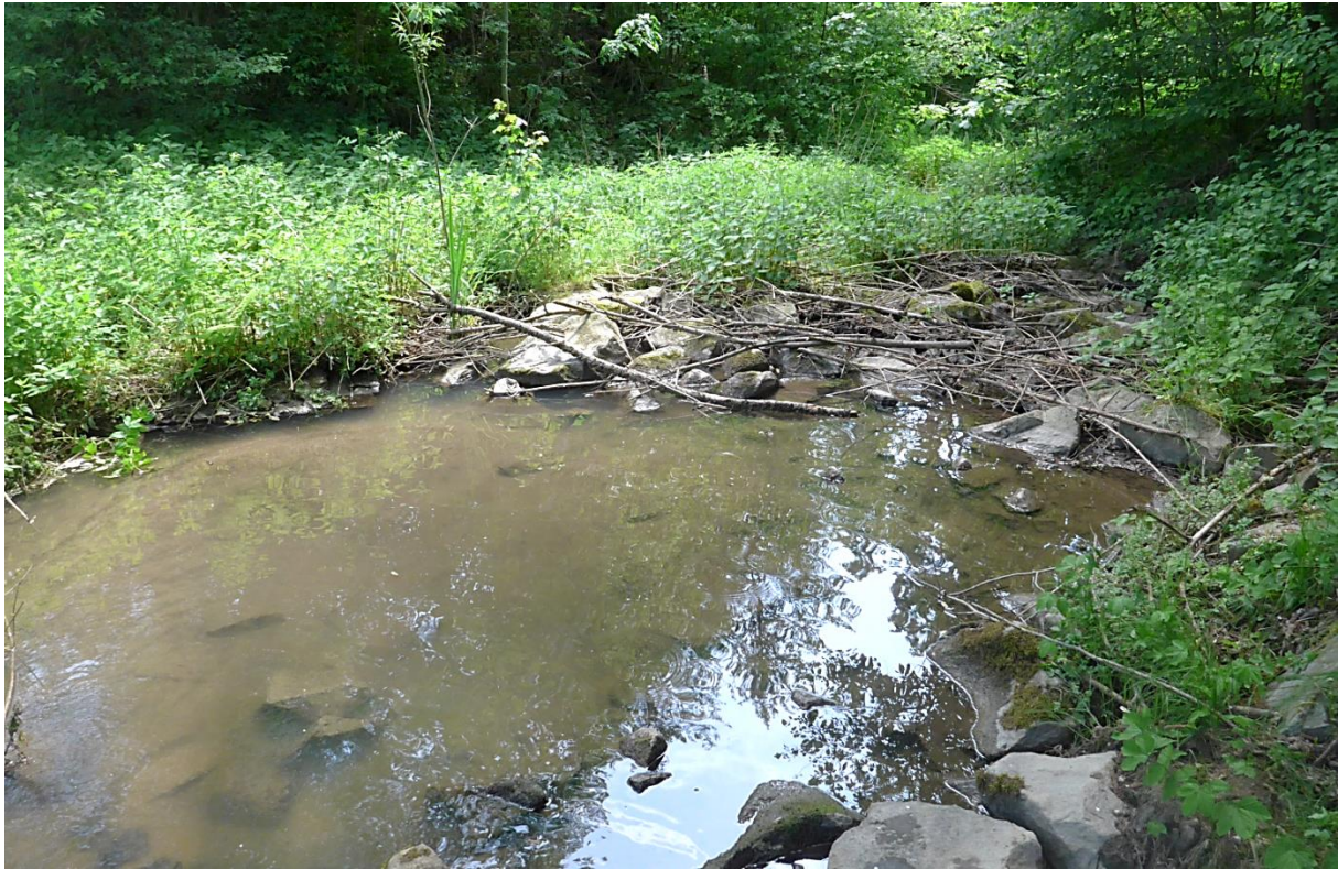
Bild 15: Standort: luftseitiger Böschungsfuß, Blick auf Tosmulde am Auslauf (2022)