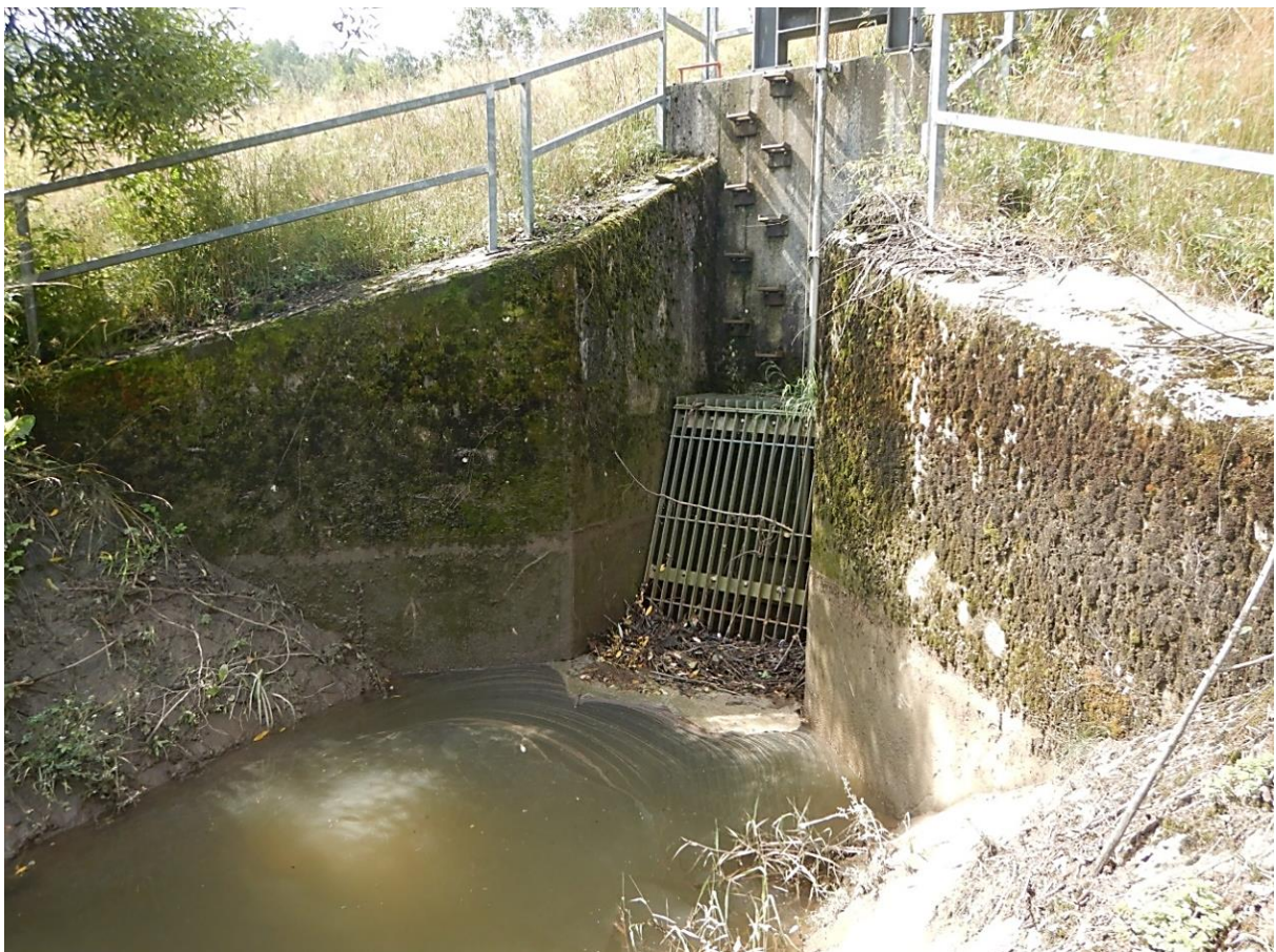
Bild 10: Standort: Wasserseitige Böschung, Blick zum Einlaufbauwerk (2019)