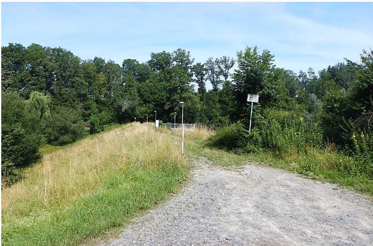
Bild 02: Standort: Zufahrt Dammkrone, Blickrichtung Nord-West auf Dammkrone (2019)