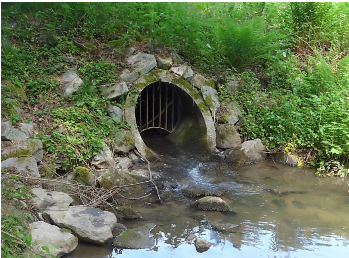
Bild 14: Standort: luftseitiger Böschungsfuß, Blick auf Auslaufbereich (2022)