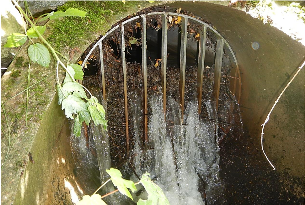
Bild 13: Standort: luftseitiger Böschungsfuß, Blick auf Auslaufbereich (2019)