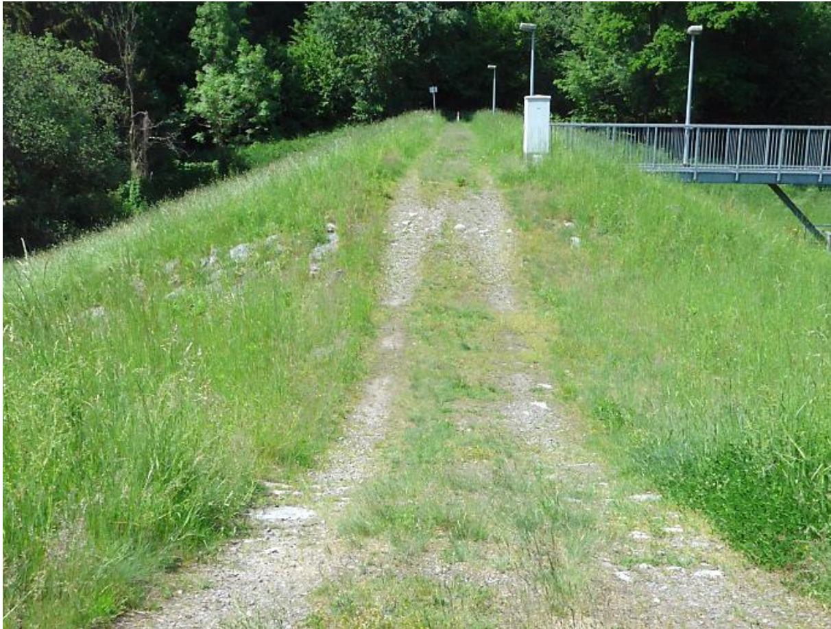
Bild 17: Standort: Dammkrone, Blick über die Dammscharte zum Bediensteg (2022)