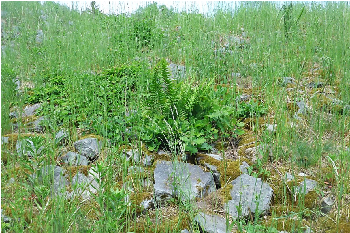
Bild 19: Standort: luftseitiger Böschungsfuß, Blick zur Dammkrone mit Steinsicherung der Ablaufmulde (2022)