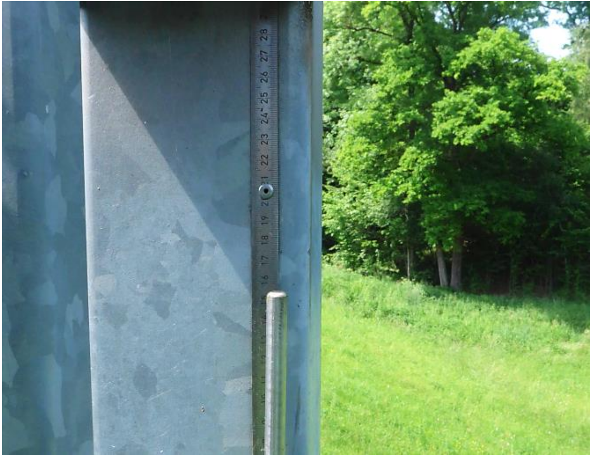
Bild 11: Standort: Wasserseitige Böschung, Blick auf Einstellstange des Schiebers (2022)