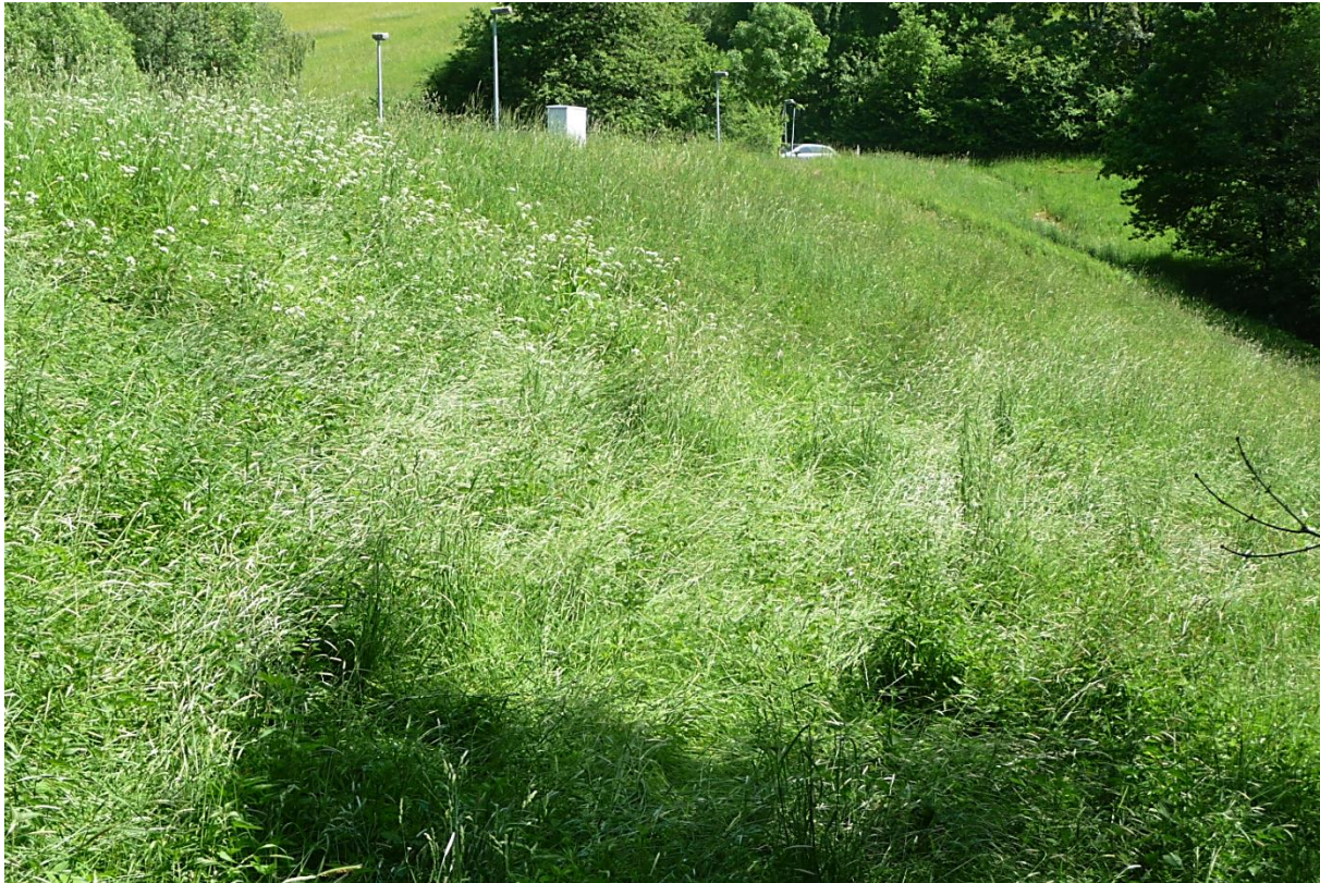
Bild 05: Standort: Dammfußpunkt Nord, Blick auf luftseitige Böschung (2022)