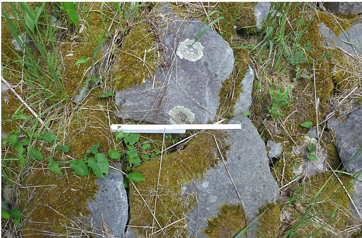
Bild 20: Standort: luftseitige Böschung, Steinsicherung der Ablaufmulde (2022)