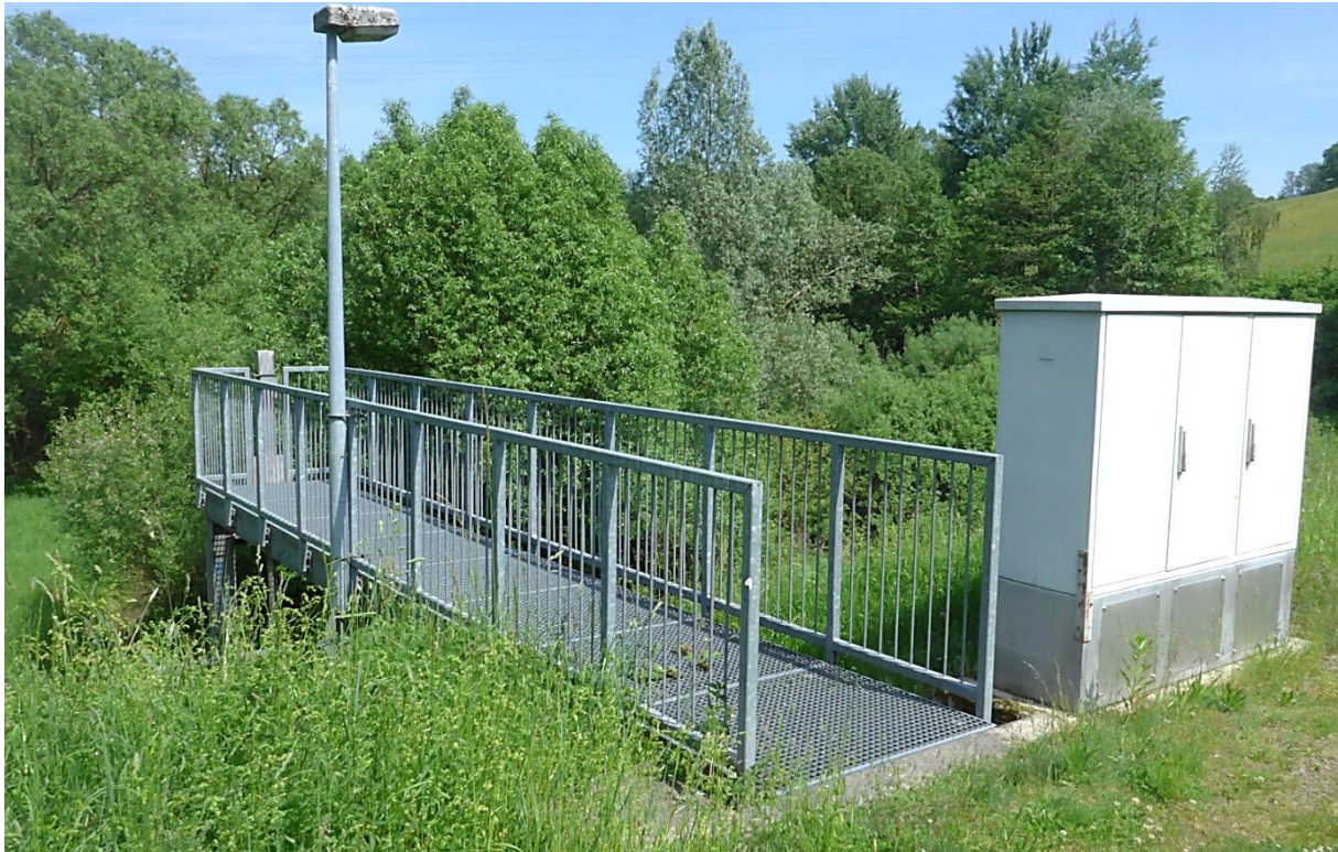
Bild 07: Standort: Dammkrone, Blick zum Bediensteg des Einlaufbauwerks (2022)