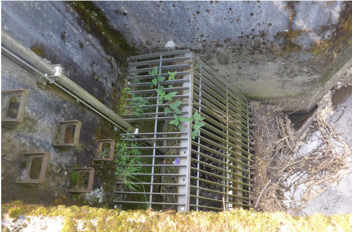
Bild 9: Standort: Wasserseitige Böschung, Blick zum Rechen vor Einlaufbauwerk (2022)