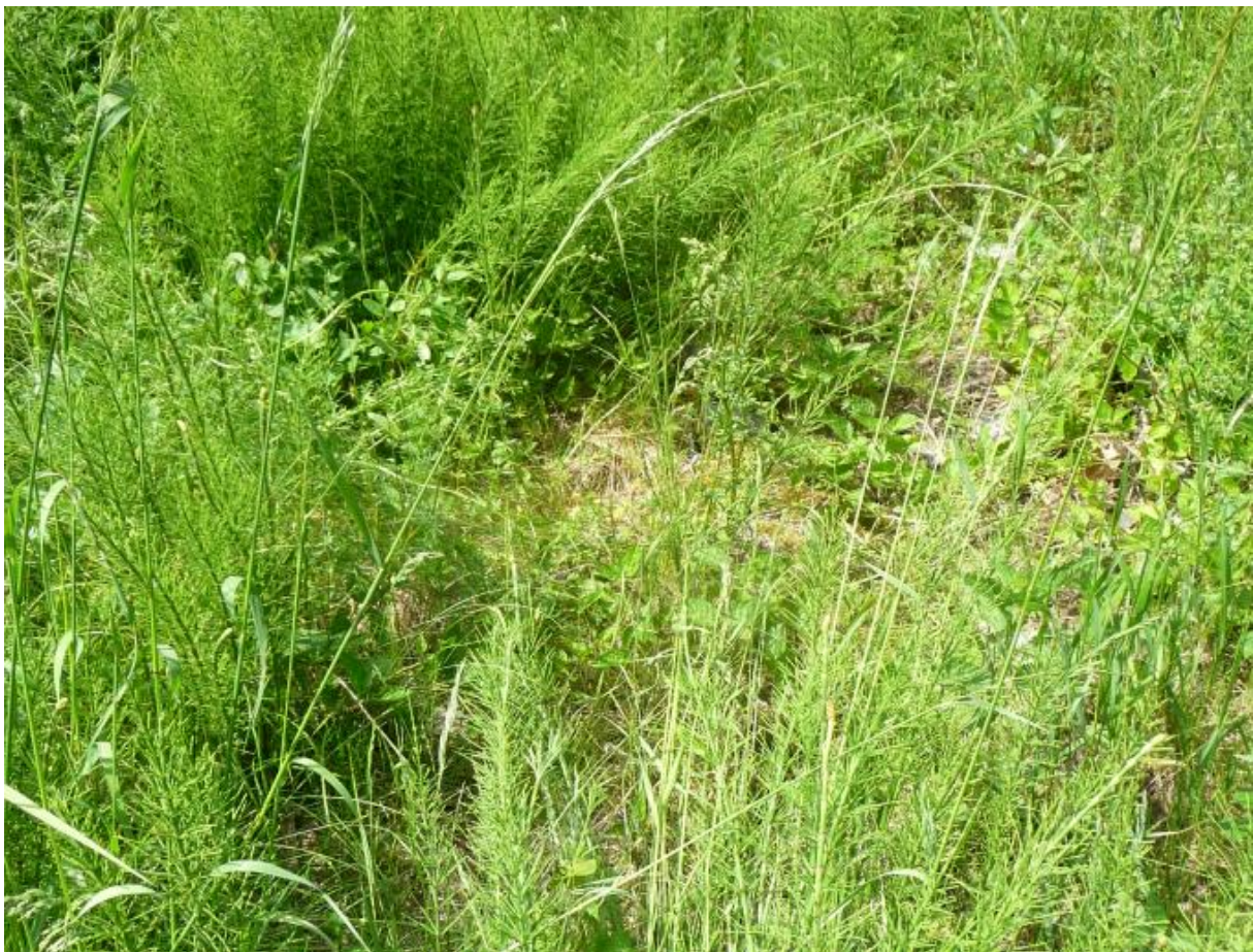
Bild 16: Standort: luftseitiger Böschungsfuß, überwucherte Sickermulde (2022)