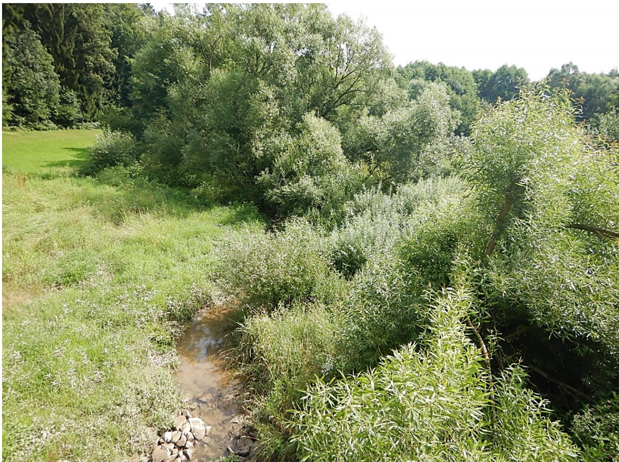
Bild 06: Standort: Dammkrone, Blickrichtung Nord-Ost auf den Aubach im Zulauf (2019)