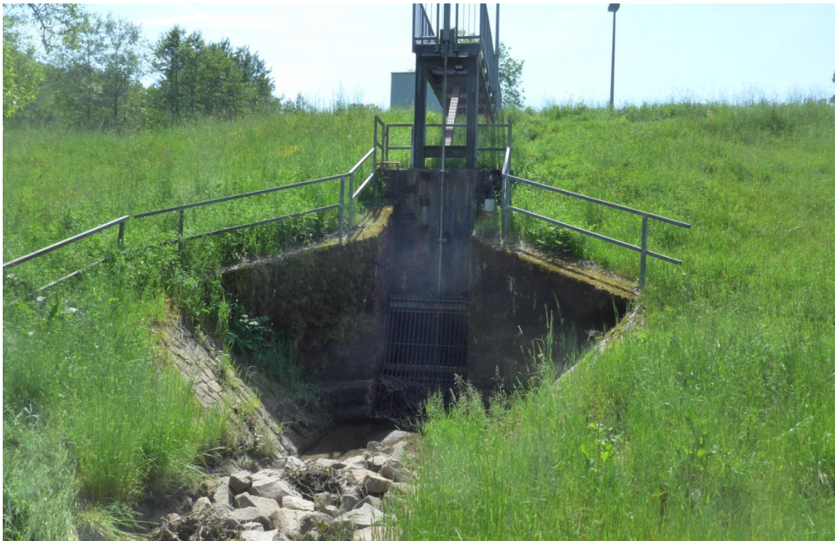
Bild 12: Standort: wasserseitiger Böschungsfuß, Blick auf Einlaufbauwerk (2022)